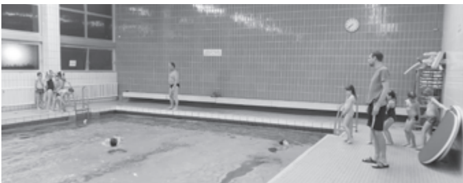
Schwimmtraining im Donnerstagskurs ab 19 Uhr