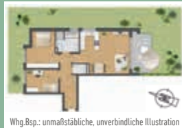
Whg. Bsp.: unmaßstäbliche, unverbindliche Illustration

3-Zi-Whg. mit sonniger Terrasse & gr. Garten ca. 88 m 2 Wfl., EG, 525.000,- €, provisionsfrei